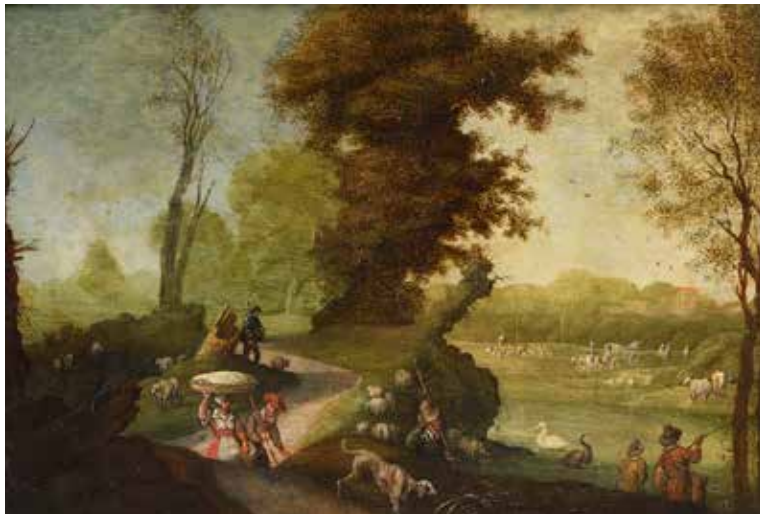
41 - Ecole FLAMANDE du XVII e siècle, entourage d'Isaac van OOSTEN Pêcheurs et chasseurs près d'une rivière Cuivre 13.5 x 19,5 cm