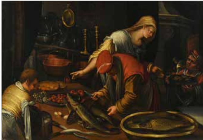
12 - Ecole ITALIENNE de la fin du XVIIe siècle, atelier de Vincenzo CAMPI Intérieur de cuisine Toile 93 x 133,5 cm