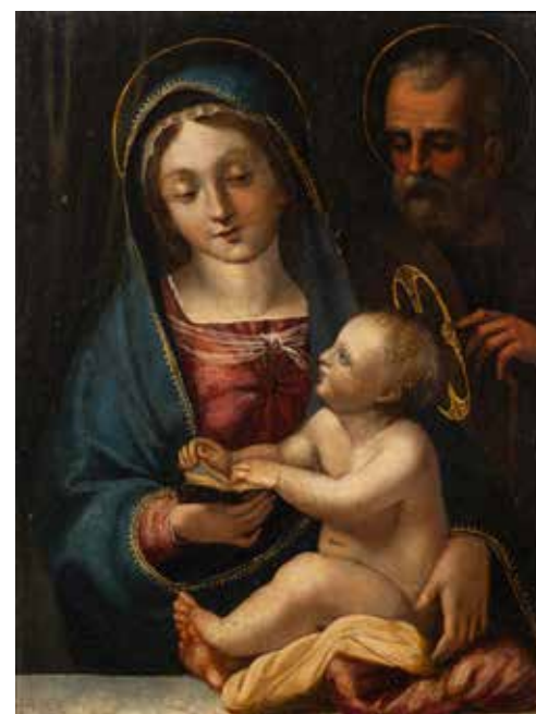
22 - Ecole ROMAINE vers 1640 La Sainte Famille au livre Cuivre 23 x 17,5 cm 600/ 800 €