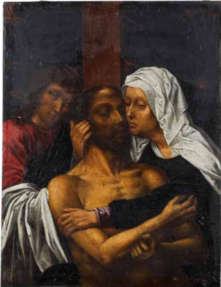
1 - Dans le goût de Gérard DAVID Descente de Croix Panneau, une planche, non parqueté 22,6 x 17,5 cm 1 500/2 000 €