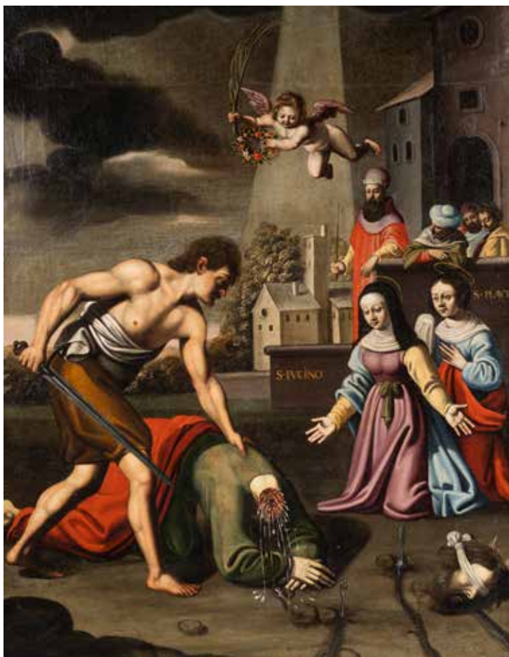
20 - Ecole FRANCAISE vers 1600, entourage de Quentin VARIN La décollation de saint Paul Toile 121 x 95 cm Restaurations anciennes et ancienne déchirure

En tant que citoyen romain, Paul est condamné à mourir par le glaive. Il est emmené sur la via Laurentina, où il est décapité. Sa tête coupée aurait rebondi 3 fois sur le sol, faisant jaillir 3 fontaines. Les deux saintes, à droite au second plan, sont sainte Lucine et sainte Plautille, deux femmes pieuses romaines. La seconde donne à saint Paul son voile, qu'il emploie comme bandeau sur les yeux pendant son exécution et qu'il lui rend miraculeusement après.