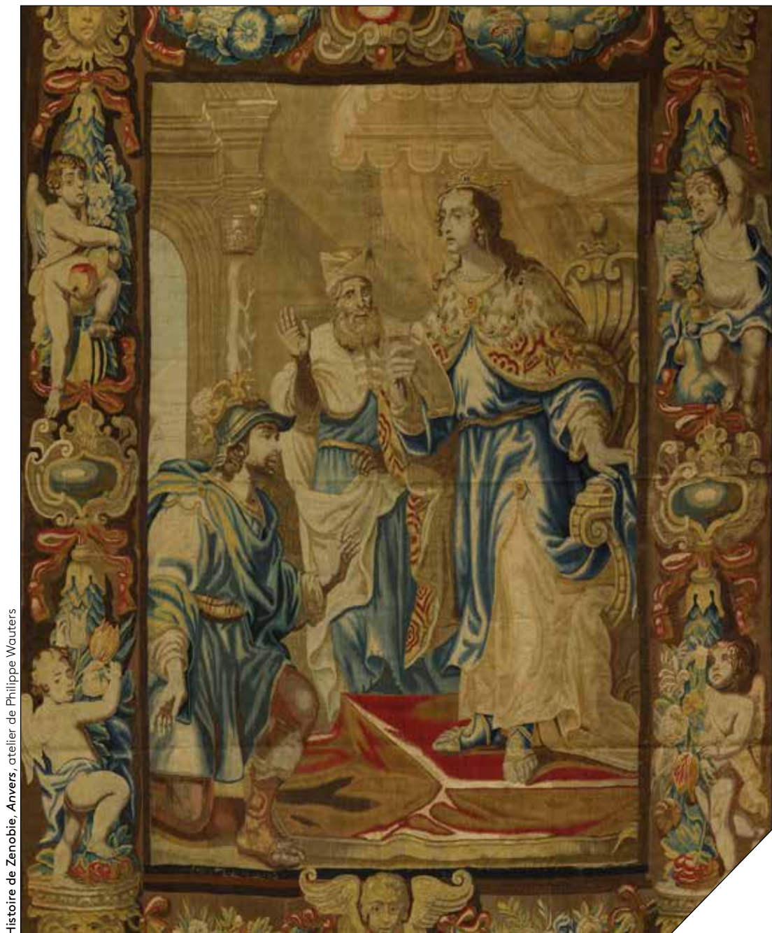
Histoire de Zenobie, Anvers, atelier de Philippe Wauters

Vente en préparation GRANDS DECORS, Siècles classiques - Décembre 2024 Hôtel Drouot