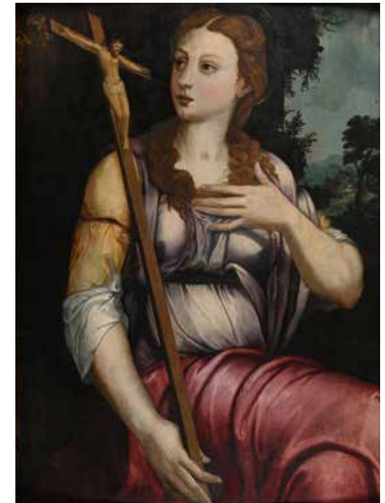
2 - Atelier d'Andrea PICCINELLI dit Andrea DEL BRESCIANINO (école sienneise, vers 1520) Marie Madeleine Huile sur panneau légèrement gondolé 102,5 x 75 cm Restaurations et usures ; au dos traces d'ancien parquetage Beau cadre sculpté et doré du XVI e siècle (restaurations)