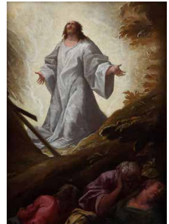
3 - Ecole EMILIENNE du XVI e siècle Christ dans le Jardin des Oliviers Huile sur toile 40,5 x 31 cm Restaurations