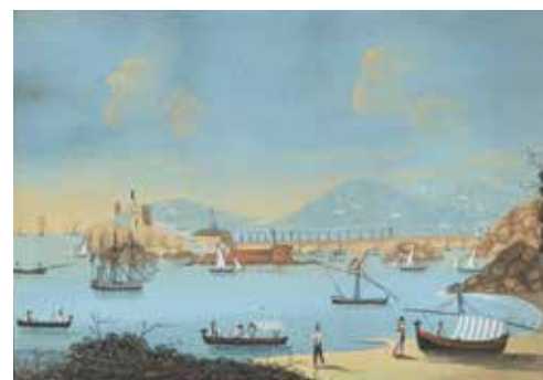
89 - Ecole ITALIENNE du XIXe siècle Vue de la baie de Naples Paire de gouaches dans des cadres en bois noirci 28,5 x 39 cm 31,5 x 43,5 cm 300/500 €