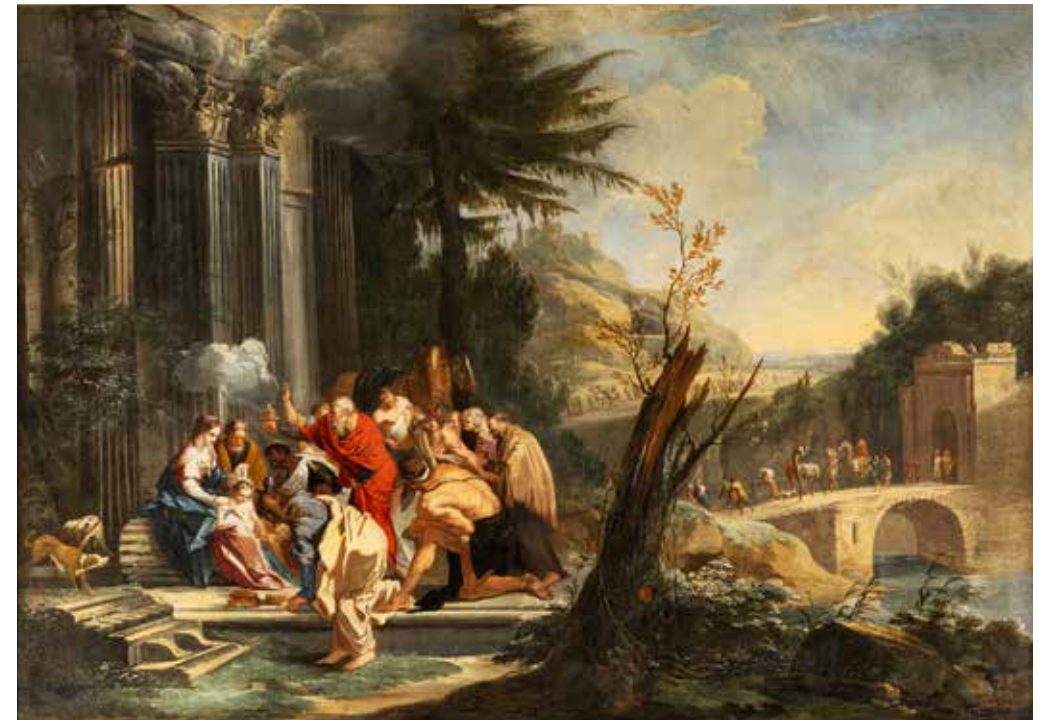
74 - Ecole ESPAGNOLE de la fin du XVIIIe siècle Adoration des mages Toile 125 x 174 cm