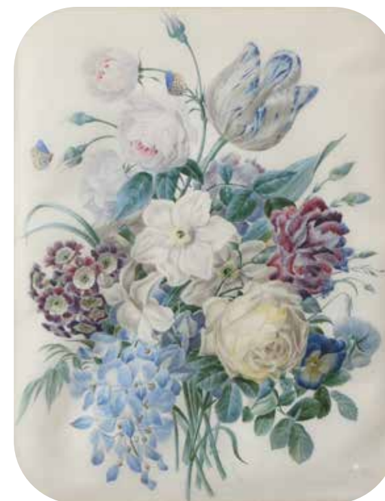
92 - Ecole FRANCAISE du XIXe siècle, dans le goût de Pierre-Joseph REDOUTE Bouquets de fleurs Paire d'aquarelles 38 x 29,5 cm Signées en bas au centre A Barochi (?) Cadres en bois et stuc doré à frises perlées, les angles arrondis