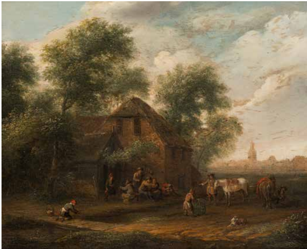
40 - Barend GAËL (Haarlem 1630 – Amsterdam 1698) Cavaliers dans une cour de ferme Panneau 24,5 x 29,5 cm

Provenance Vente anonyme, Paris Hôtel Drouot (Mes Ader Picard et Tajan), 5 mars 1986.