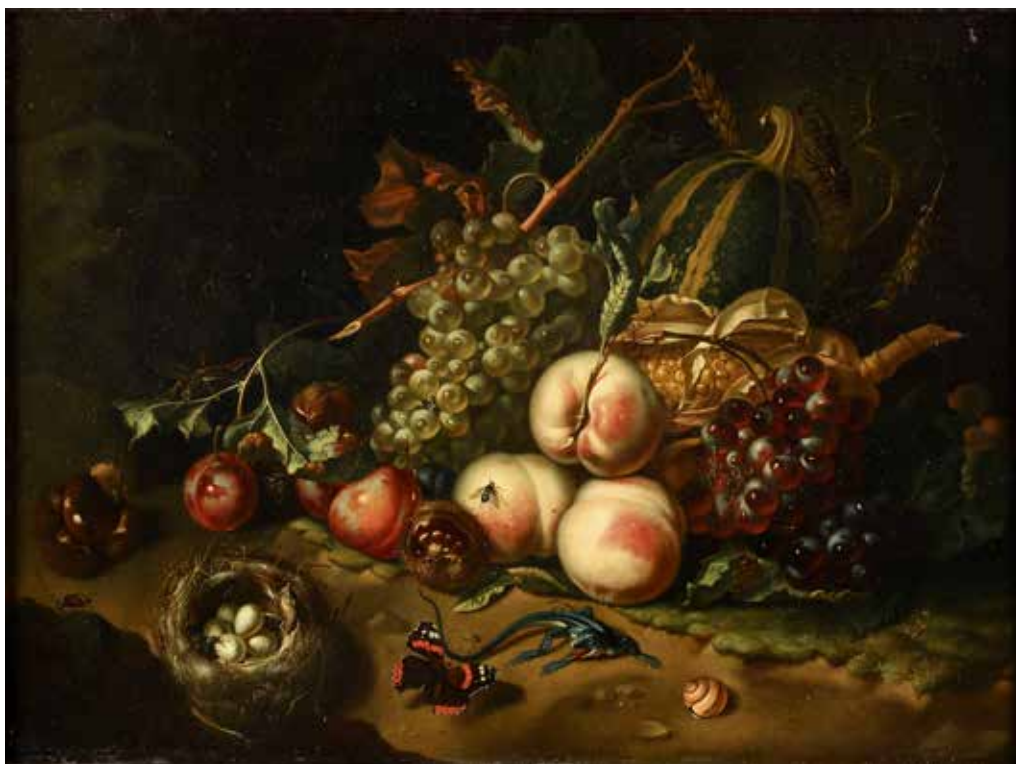
90 - Ecole HOLLANDAISE du XIXe siècle, dans le goût de Willem van AELST Fruits et nid d'oiseau Toile marouflée sur panneau 46 x 61,5 cm